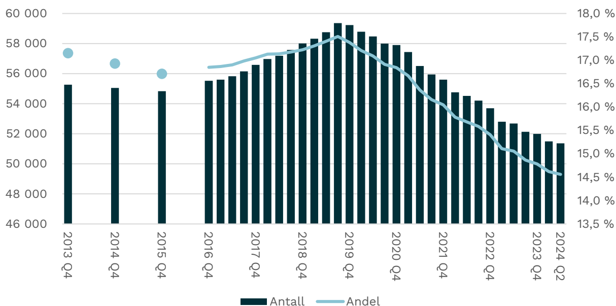
Figur 2 Sekundærboliger i Norge og større byer Andel av boligmassen. 2019 Q3 - 2024 Q2