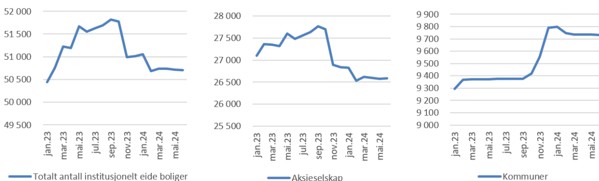
Figur 1. Antall institusjonelt eide boliger. AS, Kommuner og samlet. Jan 23 - jun 24. Oslo.

Tallene for AS-eide boliger indikerer at det er mer attraktivt å være investor utenfor Oslo. Det kan skyldes at det er mindre kapitalkrevende og derfor noe mindre rente- og skattefølsomt.